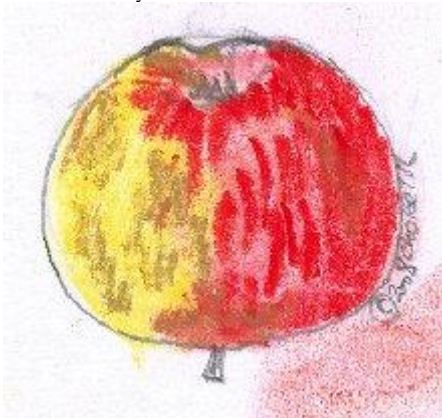
Pastel Choisel 2008 selon Diel 1833.