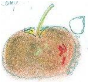
Pastel Choisel selon revue Fruchtgarten 1890. Et Deutsches Obstcabinet, 1854 p.264.

et pastel de Bruno FERRY « Pommes d'Alsace et des Vosges » Philippe GIRARDIN..1993 :Karpentiner;